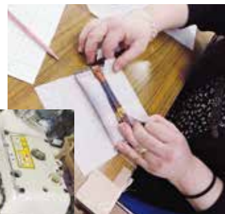
保護者の協力で 更にすばらしい製品へ