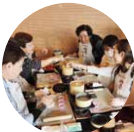
真剣な様子が よくわかるね。