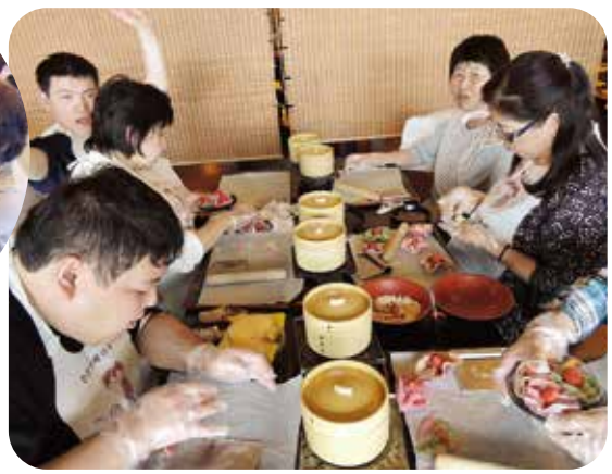
“おみやげ” できましたね。