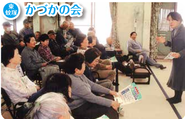
▲消費生活出前講座 寸劇「悪質商法にだまされない！」