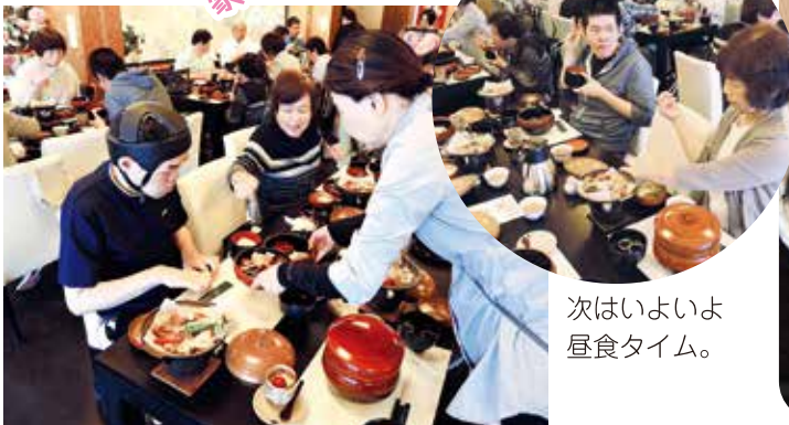
次はいよいよ 昼食タイム。