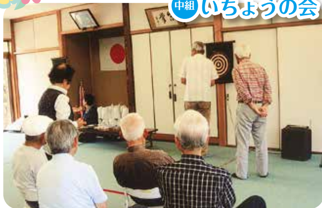
▲「マグネットダーツ」