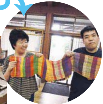
個性あふれる布が……。