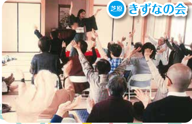
▲茂益亭蝶代様「落語・笑いヨガ」