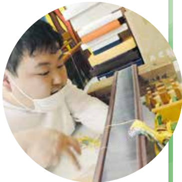
集中力がすばらしい。 作品が楽しみです。