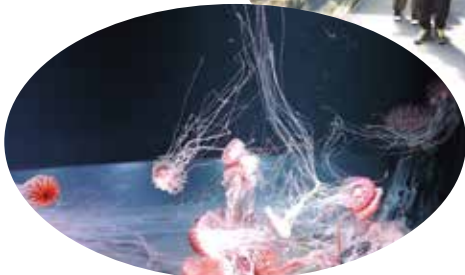
童心にもどって楽しみました。